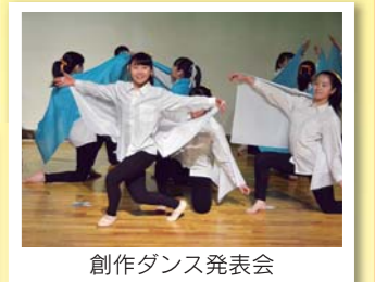
創作ダンス発表会