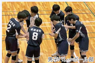
男子バレーボール部