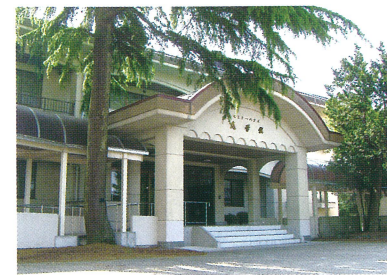
セミナーハウス 志学館