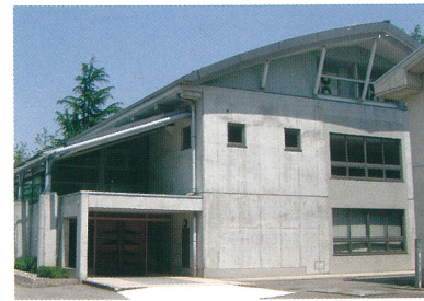
東雲ホール(創立100周年記念)

平成9年に国重要文化財の指定を受け、平成14年から4年計画で大がかりな解体、保存修理事業が行われ、平成17年8月には建築当時の姿に復元された。