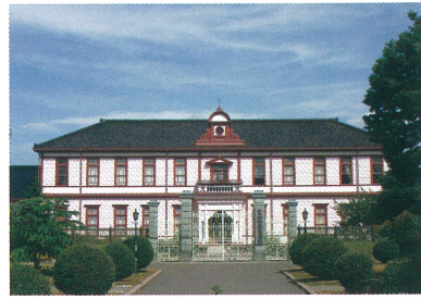
国指定重要文化財 巖浄閣全景

明治36年4月、富山県立農学校校舎として建設される。和洋折衷2階建てで明治以降の代表的な建築であり、昭和62年「富山県の建築百選」に選定された。平成9年5月、国の重要文化財に指定された。