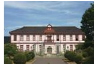
国指定重要文化財 巖淨閣全景

明治36年4月、富山県立農学校校舎として建設される。和洋折衷2階建てで明治以降の代表的な建築であり、昭和62年「富山県の建築百選」に選定された。平成9年5月、国の重要文化財に指定された。