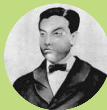
福野高校の礎を築いた鳥巖先生