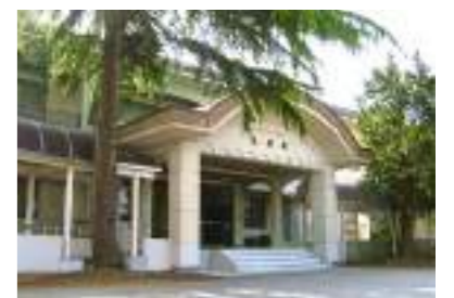
セミナーハウス 志学館(創立90周年記念)