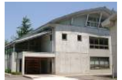
東雲ホール(創立100周年記念)

平成9年に国重要文化財の指定を受け、平成14年から4年計画で大がかりな解体、保存修理事業が行われ、平成17年8月には建築当時の姿に復元された。