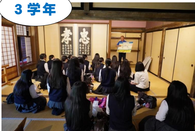
◀高山陣屋の歴史について、学びました

3学年の全学科は「高山陣屋」（高山市）を訪れました。高山陣屋内を見学し、歴史について学びました。その後は、グループで高山の古い町並みを自由散策し、食べ歩きをする姿やさるぼぼがプリントされているお土産を買う姿が見られました。