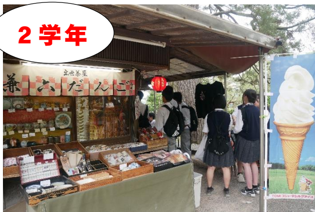
▲兼六園周辺を散策する生徒たち

2 学年普通科・国際科は、金沢市内をグループで散策しました。金沢 21 世紀美術館や金沢駅周辺など思い思いに行きたい場所へと行きました。